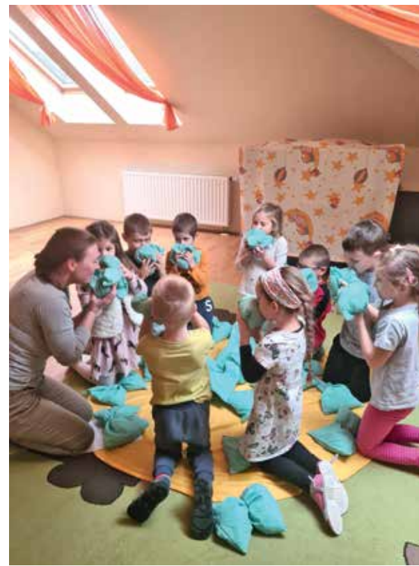
Kedvelt a bábozás a kicsik körében

A tehetséggondozás mellett az óvoda természetesen tovább folytatja a segítségre, fejlesztésre szoruló kisgyermek felzárkóztatását jól képzett szakemberekkel. Ez is a Csivitelő Óvoda erősségei közé tartozik. Továbbra is az azonos életkorú gyermekek járnak egy csoportba, nem szorgalmazzák a vegyes