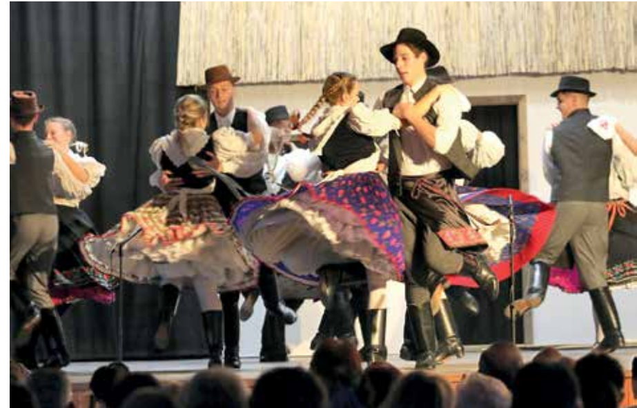
Fotóink a múlt évi karácsonyi gálán készültek

tás bekerült az országos nívós válogatásba.