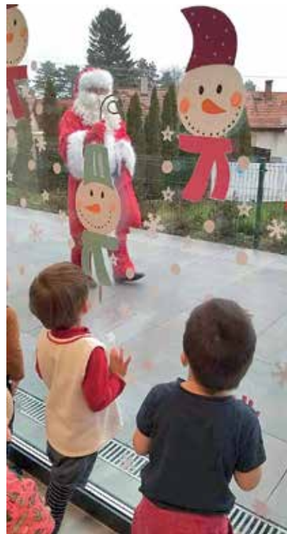
Idén csak az ablakból látták a gyerekek a Mikulást

Az idei év kiemelkedő eseménye volt a nagy sikerű Mesehét. Közösen meséket alkottak, a gyerekek kirakós feladatokat oldottak meg, megkelesték a kulesot Jázmin királykisasszony birodalmához, palotát készítettek, tehát az életkori sajátosságainak megfelelően éltek a mesékkel. Sokféle mozgásos-játékos program valósult meg, amelyekhez a Pegazus Színház biztositotta az eszközöket, Jázmin királykisasszony ruháit, aki a hét minden napján szebbnél szebb