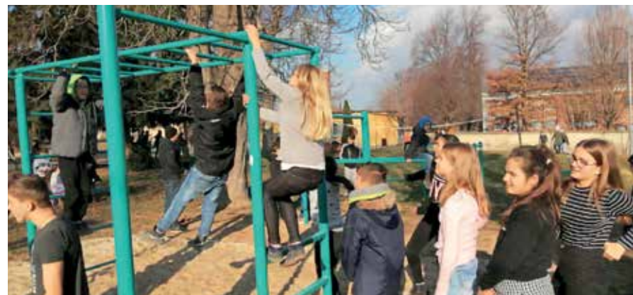
Elkészült az iskola új szabadtéri tornapályája a Litéri Általános Iskoláért Alapítvány mintegy egymillió Ft-os támogatásának köszönhetően